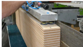
Die patentierte Silente-Unterlage, die bis zu 90 % aus natürlichen Rohstoffen besteht, wird werkseitig aufgebracht.

Die Silente-Technologie setzt Bauwerk bei seinen Produkten Cleverpark und Multipark ein. Für die Systemlösung wird eine Tritt- und Raumschalldämmunterlage werkseitig auf die Dielen aufgebracht. Das ca. 3 mm dicke Material aus bis zu 90 % natürlich vorkommenden Rohstoffen ist auslobt als geruchsneutral, alterungsbeständig sowie