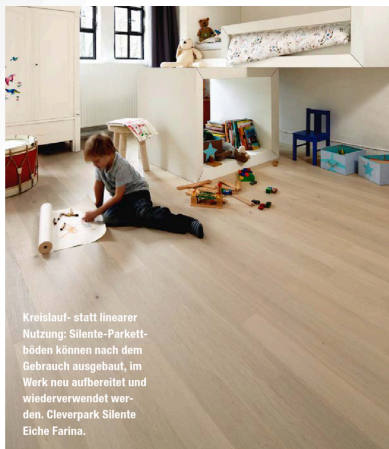
Kreislauf- statt linearer Nutzung: Silente-Parkettböden können nach dem Gebrauch ausgebaut, im Werk neu aufbereitet und wiederverwendet werden. Cleverpark Silente Eiche Farina.

Multipark Silente im Kompaktformat 12,8 x 140 x 1.200 mm ist ebenfalls zweischichtig, mit HDF-Träger und matt versiegelter 2,5 mm-Eichedeckschicht aufgebaut.