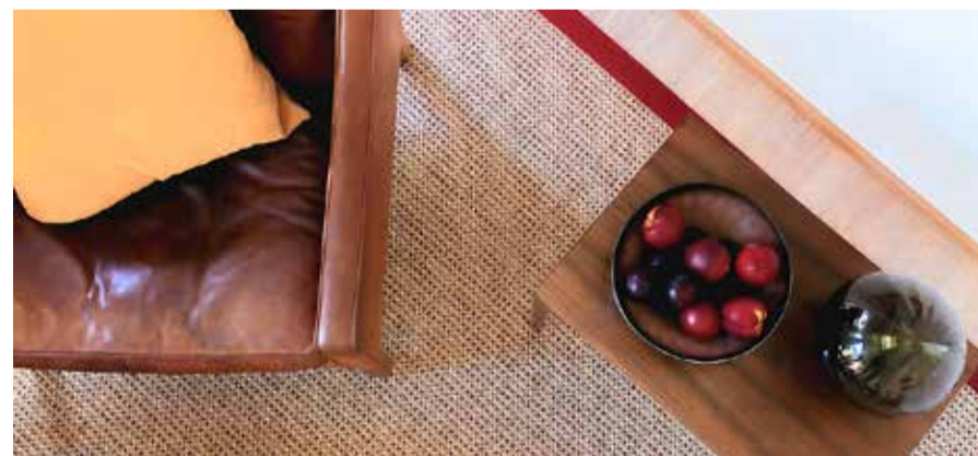
Der Sisal-Klassiker «Flow» des Schweizer Teppichspezialisten Ruckstuhl bekennet neu Farbe: Die Böden aus dezent glänzender Sisalfaser gibt es in sechs neuen Farbakzenten, hier in Rot.