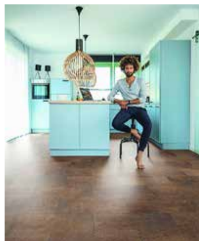
«Purline»-Bioböden von Wineo aus dem Material Ecuran.