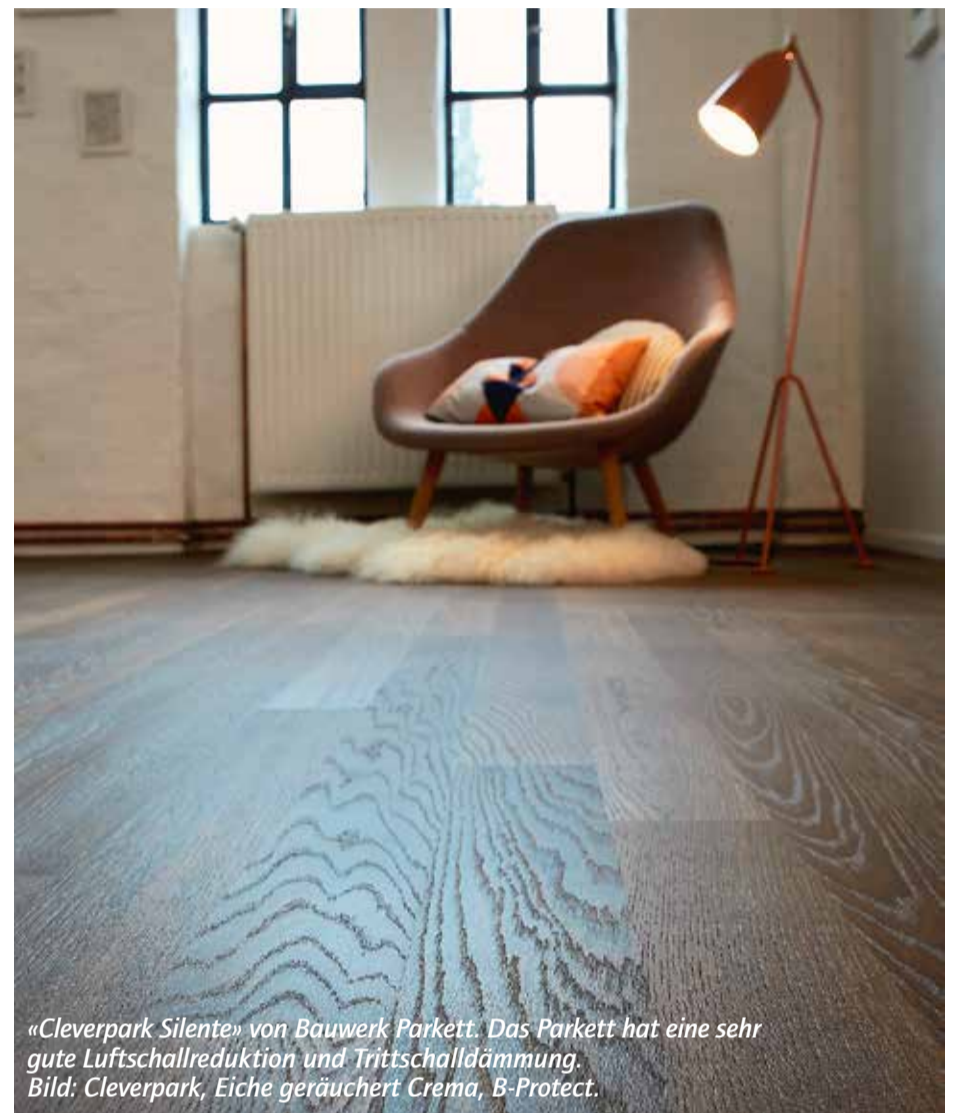
«Cleverpark Silente» von Bauwerk Parkett. Das Parkett hat eine sehr gute Luftschallreduktion und Trittschalldämmung. Bild: Cleverpark, Eiche geräuchert Crema, B-Protect.

Auch die Naturfaser Sisal steht wieder hoch im Kurs. Frei von Schadstoffen und vielseitig einsetzbar, wird das Material nicht nur von Allergikern, sondern auch von umweltbewussten Menschen geschätzt. Die strapazierbaren Fasern entstammen den Blättern der Sisal-Agave – eine dickfleischige Pflanze, die in Trockengebieten beheimatet ist. Der Schweizer Teppichspezialist Ruckstuhl lässt seinen Sisal-Klassiker «Flow» nun Farbe bekennen. Der Boden aus der dezent glänzenden Sisalfaser setzt mit sechs neuen Farbakzenten auf frische Eleganz und schafft damit in jedem Wohnraum eine behagliche Atmosphäre. Sowohl als vollflächig verlegter wie auch als abgepasster Teppich ein echtes Highlight.