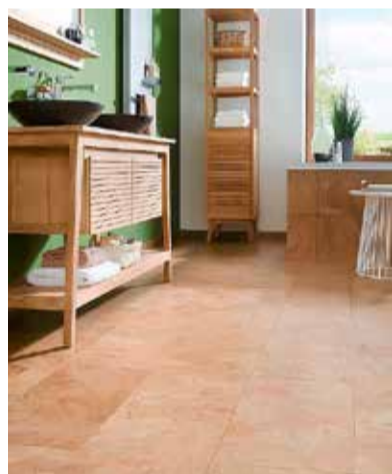
Vielseitig einsetzbar sind die Korkböden von Naturo Kork.