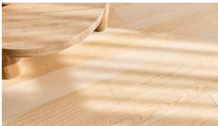
Unregelmässig gepunktete dunklere Flächen und ungemusterte Bereiche fügen sich zu einem stimmigen Ganzen zusammen: «Copenhagen»-Esche-Parkett aus der «One Ground Design Edition» von Parador.

Ob Bio-Vinyl, Kork, Sisal oder Parkett – nachhaltige Böden sorgen für ein angenehmes Raumklima ohne Schadstoffe.