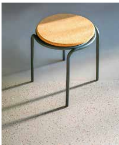
Der Vinylboden «iQ Natural» von Tarkett kann vollständig recycelt werden.