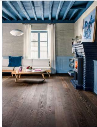
Special: Dank des mehrschichtigen Farbauftrags „Next“ verströmen die Farbtöne eine intensive Tiefenwirkung.

Natürlich bleibt Bauwerk Parkett auch seinen bekannten, bewährten und beliebten Qualitäten treu. Der renommierte Naturholzboden-Profi setzt bei der Entwicklung und Herstellung auf Wohngesundheit, Langlebigkeit, Qualität und Design, und die neue Parkett-Edition True Colours kombiniert diese Merkmale auf besonders schöne Art und Weise. Als Cradle to Cradle Certified™ Hersteller bietet Bauwerk die Garantie, dass bei diesen Produkten keine bedenklichen flüchtigen organischen Verbindungen unwissentlich oder versteckt eingebaut werden, wodurch ein gutes Raumklima und volle Wohngesundheit für Mensch und Tier gewährleistet sind – auch mit der True Colours Edition mit ihrer außergewöhnlichen, vorgegebenen, wohl gewählten Patina.