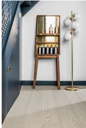
Überraschend beeindruckend: Die helle „Eiche angeräuchert Nebbia“.

Ist Canneto das italienische Wort für Schilf, spiegelt der Braunton „Eiche angeräuchert Canneto“ das natürliche, dezent gedeckte Farbspiel von Schilfblättern wider, die sich am Ufer leicht und leise raschelnd im Wind bewegen.