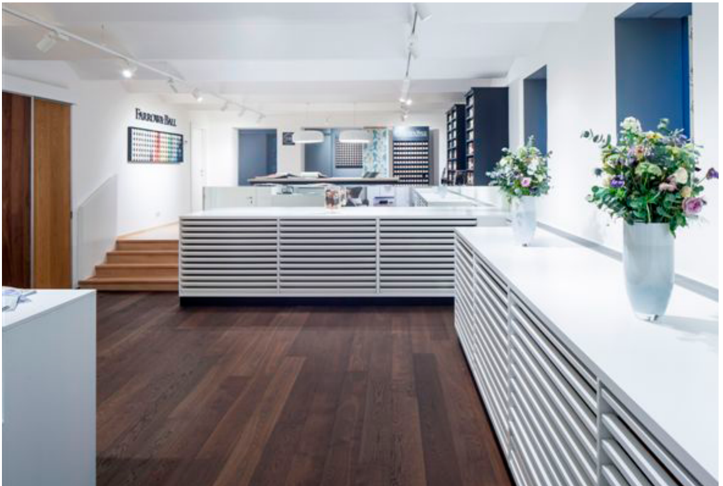
Optimale Integration des Bauwerk Shop-in-Shop-Konzepts in einen bestehenden Shop. Gesehen bei Graf Marvin in Wien (AT)

Sie, als Partner von Bauwerk, können von unserer starken Marke profitieren. Unser Shop-in-Shop-System präsentiert unsere wunderschönen Holzböden im besten Licht. Beim Bauwerk-Shop-in-Shop geht es jedoch noch viel weiter als nur um eine reine Produktpräsentation. Es geht darum Emotionen zu wecken, zu inspirieren und den Mehrwert Bauwerk zu verkaufen.