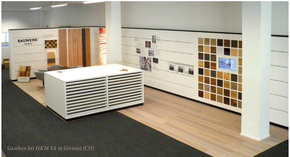
Gesehen bei HKM SA in Givisiez (CH)

Ab ihrem «GO» dauert es ca. 8 Wochen und der Shop steht fixfertig.